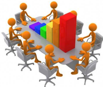
TAVOLA ROTONDA : “OLTRE LE PROROGHE, PER UNA SICUREZZA SOSTENIBILE NELLA SCUOLA”

OBIETTIVI: Fare acquisire una visione chiara dei singoli problemi adottando, ove possibile, dei corretti modelli di analisi delle varie situazioni che, pur nella loro generalità, sappiano suggerire soluzioni efficacemente praticabili nei vari contesti scolastici.